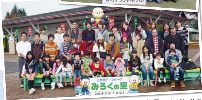
みろくの里とみかん狩り旅行