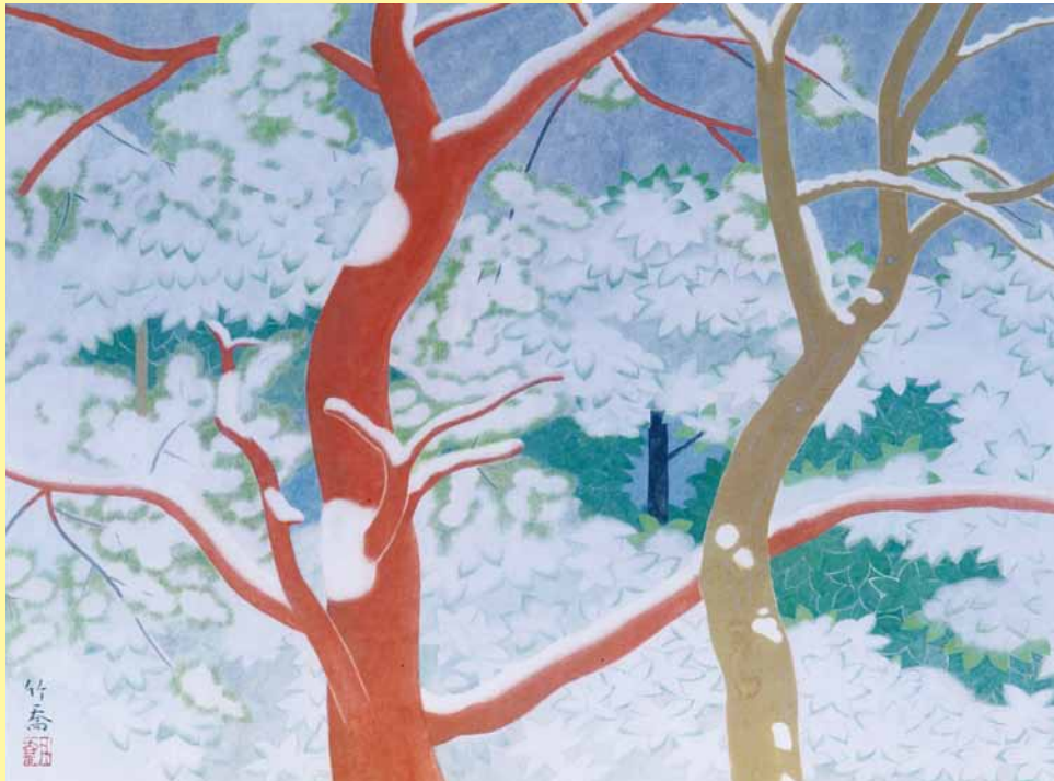
表紙絵:小野 竹喬「彩雪」 (公財)ワコースポーツ・文化振興財団 所蔵

われわれは、「愛と献身」を基本方針とし、 利用者のこころとからだを癒し、 安全で品質の高い介護サービスを 提供することで地域社会に貢献する。 社会福祉法人 天神会