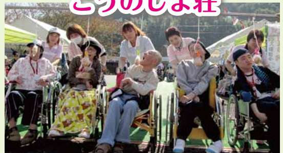
運動会 パン食い競争