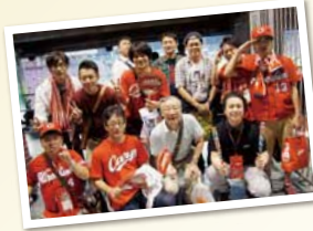
広島カープ観戦旅行

二泊三日…北海道 2班 一泊二日…広島カープ観戦 大阪・神戸 (USJ・王子動物園) 兵庫 有馬温泉 小豆島 (釣り・観光・ゴルフ) 日 帰 り…ニューレオマワールド みろくの里とみかん狩り 2班 京都 (川床料理) 牛窓 (土ひねり体験)