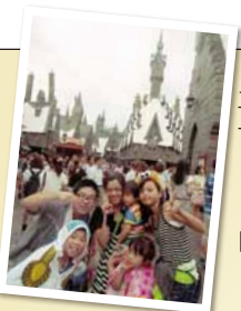
大阪・神戸、USJ・王子動物園

二泊三日…北海道 2班 一泊二日…広島カープ観戦 大阪・神戸 (USJ・王子動物園) 兵庫 有馬温泉 小豆島 (釣り・観光・ゴルフ) 日 帰 り…ニューレオマワールド みろくの里とみかん狩り 2班 京都 (川床料理) 牛窓 (土ひねり体験)