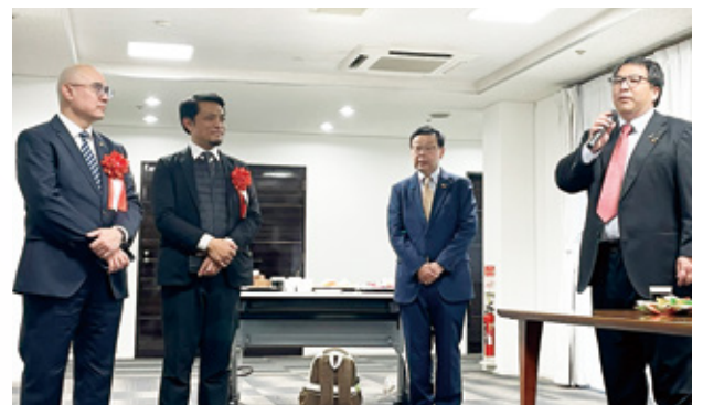
懇親会 在大阪インドネシア総領事をお迎えして