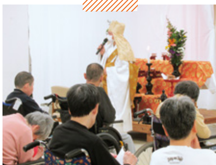
障害者支援施設このしま荘 彼岸供養