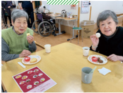
このしま介護老人保健施設 スイーツバイキング