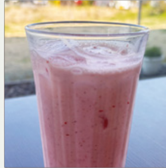
いちごスムージー