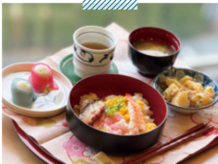
特別養護老人ホーム ひな祭りのちらし寿司