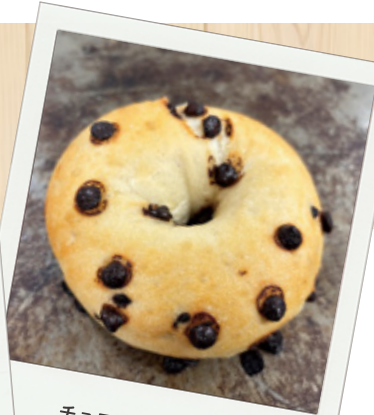
チョコチップベーグル