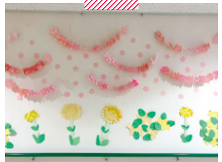
軽費老人ホーム ケアハウスこのしま 春の壁飾り(入所者様手作り)