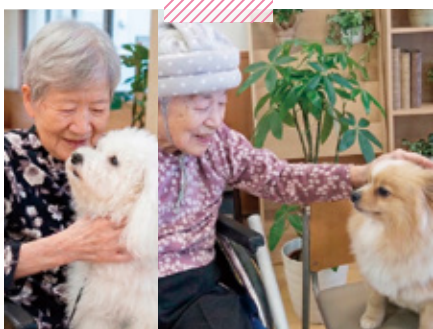
特別養護老人ホーム天神荘 サリークラブ(ドッグセラピー)