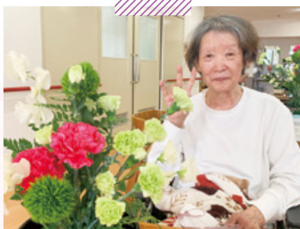
天神介護老人保健施設 生花クラブ