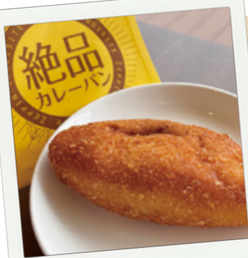
ビーフカレーパン