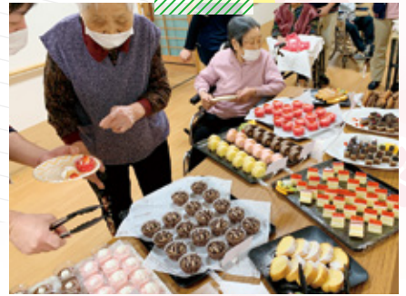
このしま介護老人保健施設 スイーツバイキング