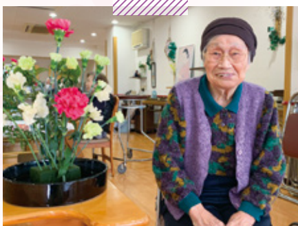
天神介護老人保健施設 生花クラブ