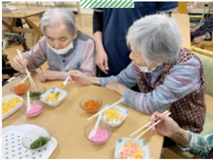
このしま介護老人保健施設 ちらし寿司づくり