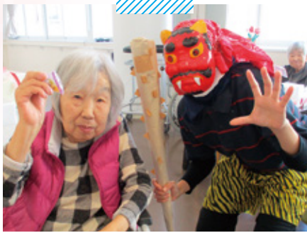
サービス付高齢者向け住宅 Prince Court 節分