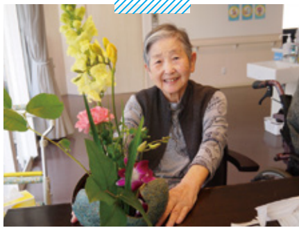
サービス付高齢者向け住宅 Prince Court 生花クラブ