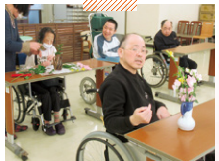
障害者支援施設このしま荘 生花クラブ