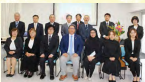
永年勤続表彰 十年