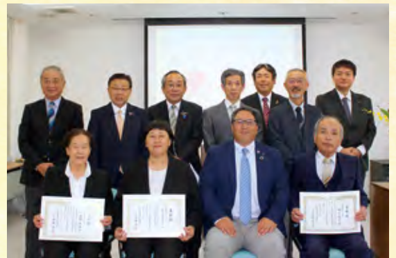
永年勤続表彰 三十年