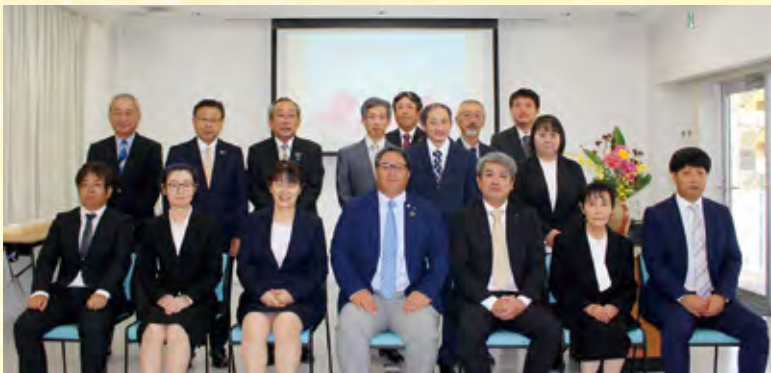
永年勤続表彰 二十五年