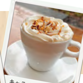
キャラメルナッツラテ (¥350)