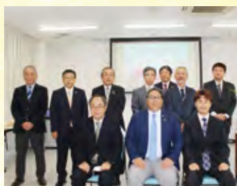
永年勤続表彰 十五年