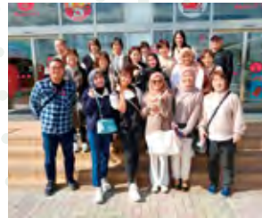
神戸三田 めんたいパーク