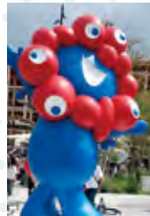
万博 ミャクミャク