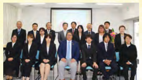
永年勤続表彰 二十年