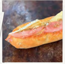
生ハムカマンベールカスクート (¥300)