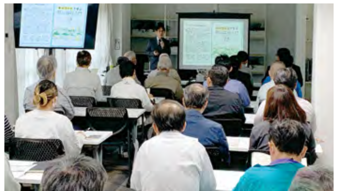
防災・災害福祉研修会