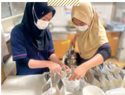
天神介護老人保健施設 災害食訓練