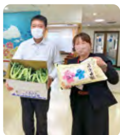
障害者支援施設こうのしま荘