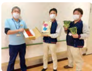
こうのしま介護老人保健施設