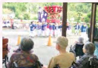
神鳥秋祭りに参加