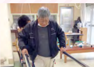
個別リハビリの様子

このしま老健デイケアセンターでは、ご利用者様の在宅生活の継続を少しでも手助けできるように、全職員が一つのチームとなってケアに当たっています。当施設では、個別リハビリに力を入れたい支援の方、要介護の方、皆さんが機能・能力の向上に努めています。また、笠岡市と協力し、認知機能低下の予防や改善を目的に「学習療法くもん」も実施し、活気のある空間づくりを行ってご好評を頂いています。新たな取り組みとして、より良いリハビリ・ケアが提供できるように、歩行分析アプリを導入します。最新のAI機能を駆使しながら入所部門と協力し、シームレスなケアが提供できるように、日々努めていきたいです。ご利用者の皆様、当施設をご利用いただきありがとうございます。これからも元氣にお会いできることを職員一同楽しみにしています。