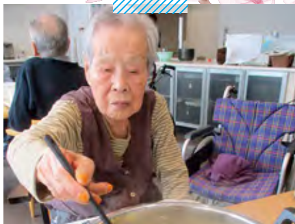
サービス付高齢者向け住宅 Prince Court しゃぶしゃぶバイキング