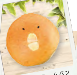
びよ吉のクリームパン (¥100)