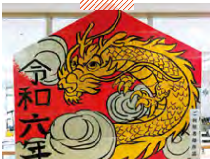
障害者支援施設こうのしま荘 干支の絵馬ちぎり絵たつ