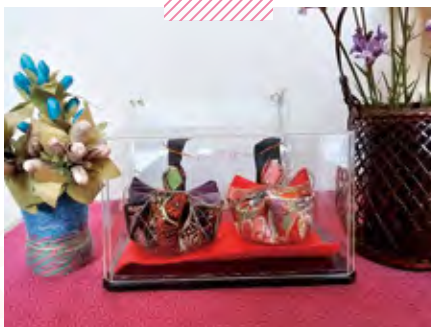
天神荘ホームヘルプサービス ひな祭り