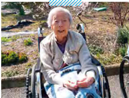
サービス付高齢者向け住宅 Prince Court お散歩日和