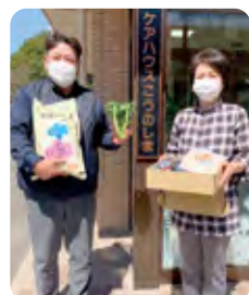
軽費老人ホーム ケアハウスこうのしま