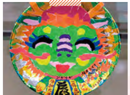
障害者支援施設こうのしま荘 昇龍てきな？