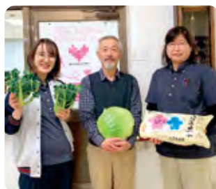
天神介護老人保健施設 いただいた副賞でカレーパーティー!! おいしくいただきました。