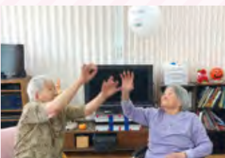
日課のレクリエーション