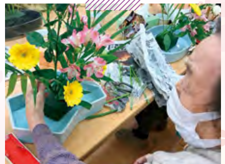
天神老健デイケアセンター 生花クラブ