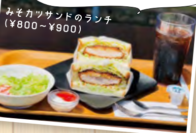
みそカツサンドのランチ (¥800~¥900)