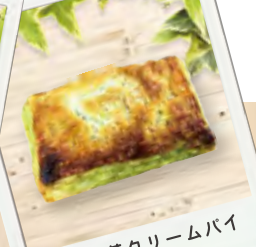
宇治抹茶クリームパイ (¥180)