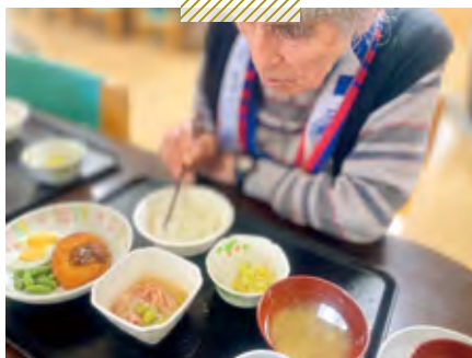
天神介護老人保健施設 災害食試を試食