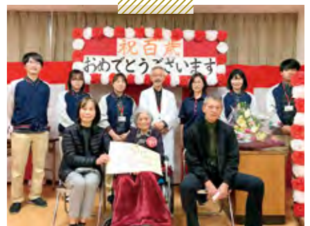
天神介護老人保健施設 百歳記念式典