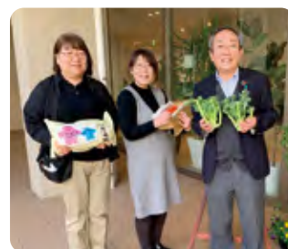
サービス付高齢者向け住宅 Prince Court