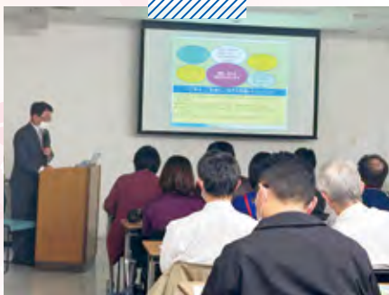
法人内研修 ハラスメント研修会