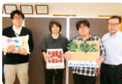
特別養護老人ホーム天神荘