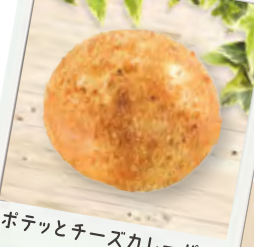
ポテッとチーズカレーパン (¥160)