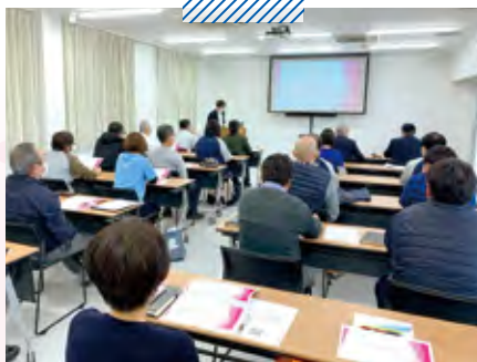
法人内研修 コンプライアンス研修会