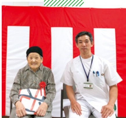
こうのしま介護老人保健施設 敬老の日