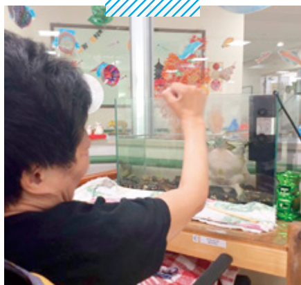
障害者支援施設こうのしま荘 アイドルの仕事