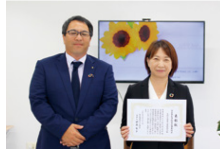
安全衛生活動優良事業所賞