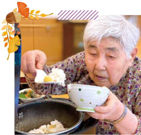
特別養護老人ホーム天神荘 秋の香りを感じます／敬老の日