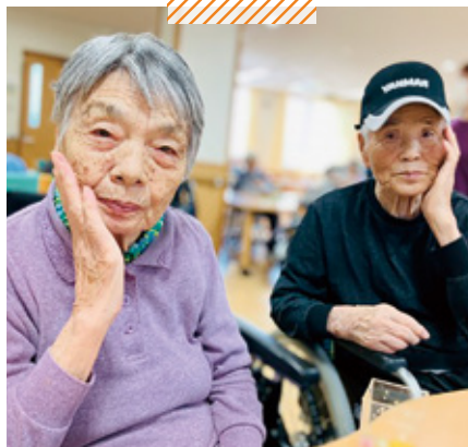
天神介護老人保健施設 秋の果物バイキング