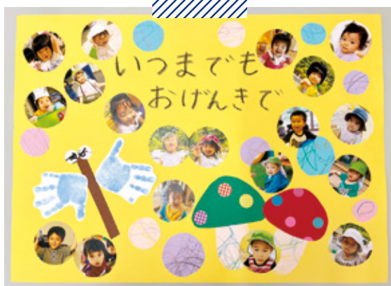
クレヨンKIDS 敬老の日のお届け物