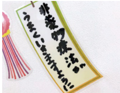
サービス付高齢者向け住宅 Prince Court 猪原 千里