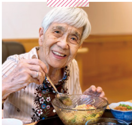
特別養護老人ホーム天神荘 夏の風物詩/父の日のプレゼント