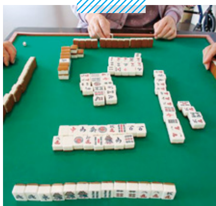
サービス付高齢者向け住宅 Prince Court 料理クラブ ～鈴カステラづくり～/麻雀クラブ/生花クラブ