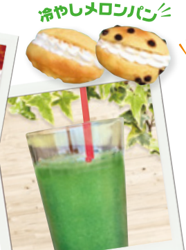
冷やしメロンパン 小松菜とりんごのスムージー