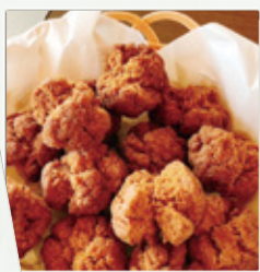
サターアンググー