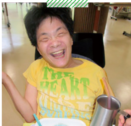
障害者支援施設こうのしま荘 カレーパーティ/七夕喫茶/シャボン玉