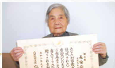
100歳おめでとうございます!