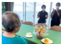
職員とお誕生日会