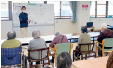
「おとなの学校」 教科書を使用した学校形式の認知症学習療法。 高齢者が「学び」で元気になる。