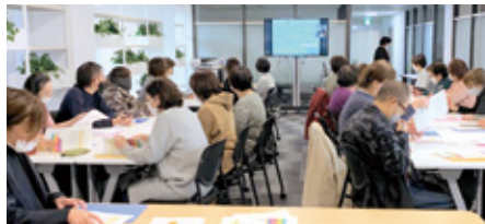
看護職の自主勉強会「介護施設で働く看護職のキャリア開発」外部講師によるオンライン研修会

昨年、新しく看護部会が発足しました。目標は、①介護施設における看護職員の役割と機能充実。②看護職としてのスキルアップを目指しチームケアの推進。看護職としての基本を再認識し、ここからスタートしました。介護施設で働く看護職員は、看護判断を求められる事が多くあります。過去の経験だけに頼るのではなく自己研鑽しながら、ご利用者様が持つ疾病や加齢に伴う心身機能低下を理解し、人生の最期まで責任をもって支援できる看護職になりたいと思っています。昨年度は、看護職としてのスキルの自己点検を行いました。法人の全看護職が自身のスキルを確認することが出来たと思います。そして、自身の課題も見えてきたのではないのでしょうか。