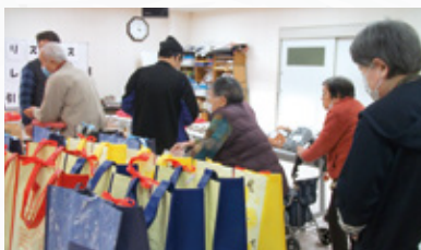
クリスマス抽選会 -豪華賞品と引き換え中です-

二〇二一年は、延期や中止となった様々な催しが開催され、一陽来復して活気のある年であることを願います。