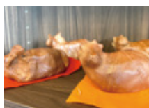
個性豊かな今年の干支「丑」

Prince Court サ高住の取組では、昨年 9月より入居者様に日々の生活をより楽 しんでいただくため、ヨガ体操や陶芸、ス イーツ作り、ビュートイマツサージなど 様々な催しを企画・実施しています。参加 された入居者様からは笑顔で「次回も楽し み」と言っていたり、嬉しそうな顔で「次 回も楽しみにしています」と言っていたり と、中には「楽しさ」を持っていただくこ との大切さを感じています。今後も、コ ロナ禍でも他入居者様と仲良く、楽し く過ごしていただけるよう努めてまいり ます。