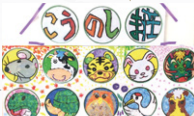
ご利用者様が作られるちぎり絵作品