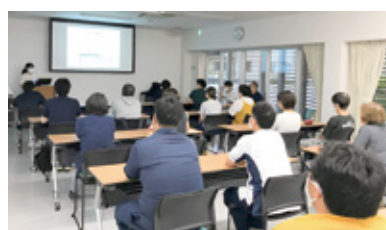
他部門を交えた勉強会を開催

私たちは地域への貢献活動として「出前講座」を開催しています。コロナ禍で制限がありますが、地域の方との触れ合い、福祉に関する知識、技術の提供、福祉に関する要望などの聴き取りを行い、少しでも地域に貢献できるように取り組んでいきます。