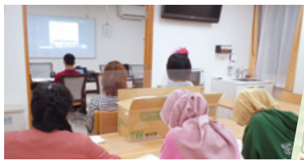
各施設を繋いでオンライン研修会

介護部会では、施設を横断して介護分野における知識、技術のスキルアップを念頭に活動しておりますが、今年度は、新型コロナウイルス感染症の流行に伴い、外部研修、施設内研修などに制約があるのが現状です。その中で今できる事は何かを考え、十月二十日にWEBを活用した法人内のオンラインの研修会を実施しました。今後も、少しでも良い支援に繋がられるよう取り組んでいきたいと思っています。