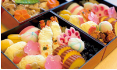
天神荘のお正月 -おいしいおせちを囲んで-

「暮らしの継続」の理念の下、感染予防対策をすすめながら、一人ひとりに普段と変わらない暮らしをお送りいただけるよう、職員一同心を一つに努めて参ります。本年もどうぞよろしくお願ひ申し上げます。