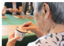
夢中で制作中です！