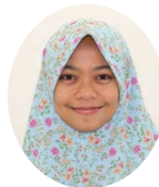
アストゥティドゥイ ワルダニ