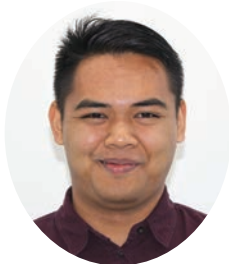
ブティ スタルヤント