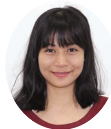
トゥリ アユ フィルギナ セプティアニ