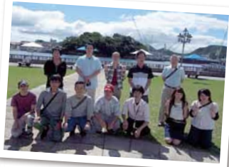
尾道散策と野球観戦