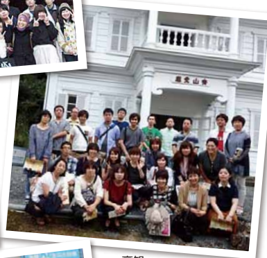
高知 「仁淀ブルー」と屋形船遊覧