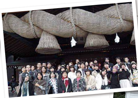
皆生温泉カニ会席と 出雲大社参拝