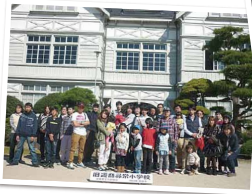
旧遷高尋常小学校と蒜山ジョイフルパーク