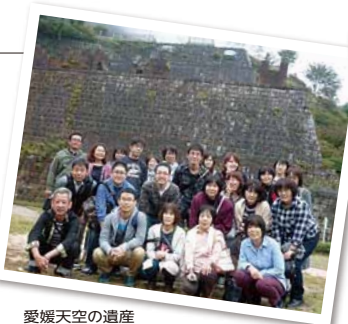
愛媛天空の遺産 「別子銅山」と砥部焼体験

天神会では8月から12月の期間に計8班に分かれ職員旅行が行われました。今年もバラエティーに富んだ旅行プランが盛り沢山で、総勢208名の参加がありました。皆、それぞれの旅行で楽しいひと時を過ごし、心身ともにリフレッシュすることができ、より一層仕事への英気を養うことができました。