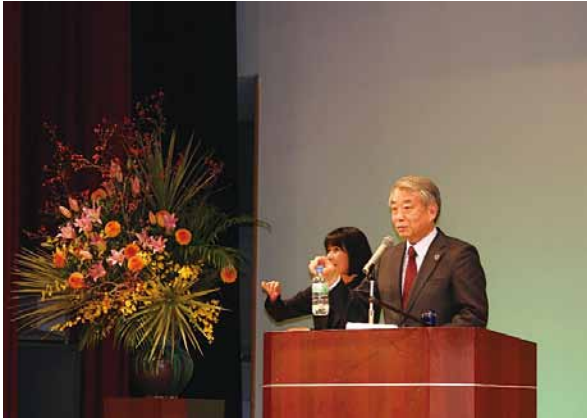
日体大総合研究所所長 日本体育大学保健医療学部教授 日本転倒予防学会理事長

誰もが年を重ね、からだも弱り、病気にかかり、運動不足状態がつけば転倒しやすくなります。厚生労働省の人口動態統計によれば、「転倒」は、