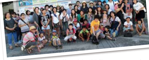
神戸須磨海浜水族館とカフェランチ×2班